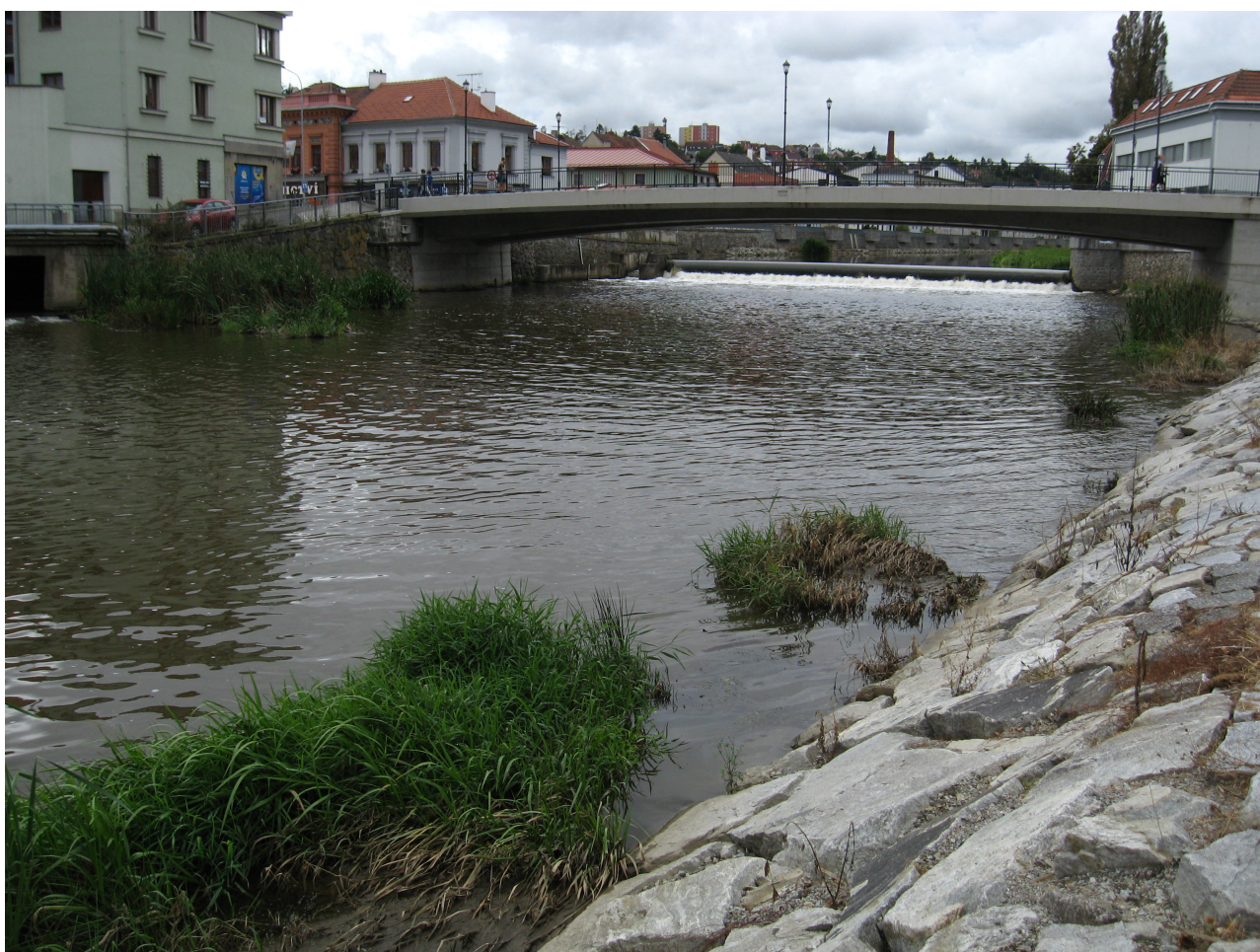
Obr. 4. Jihlava v Třebíči (lok. č. 14). Fig. 4. The Jihlava River in Třebíč (site 14).