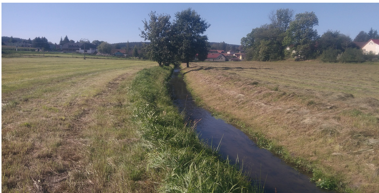
Obr. 3. Jihlava na svém horním toku (lok. č. 35). Fig. 3. The Jihlava River in its upper section (site 35).