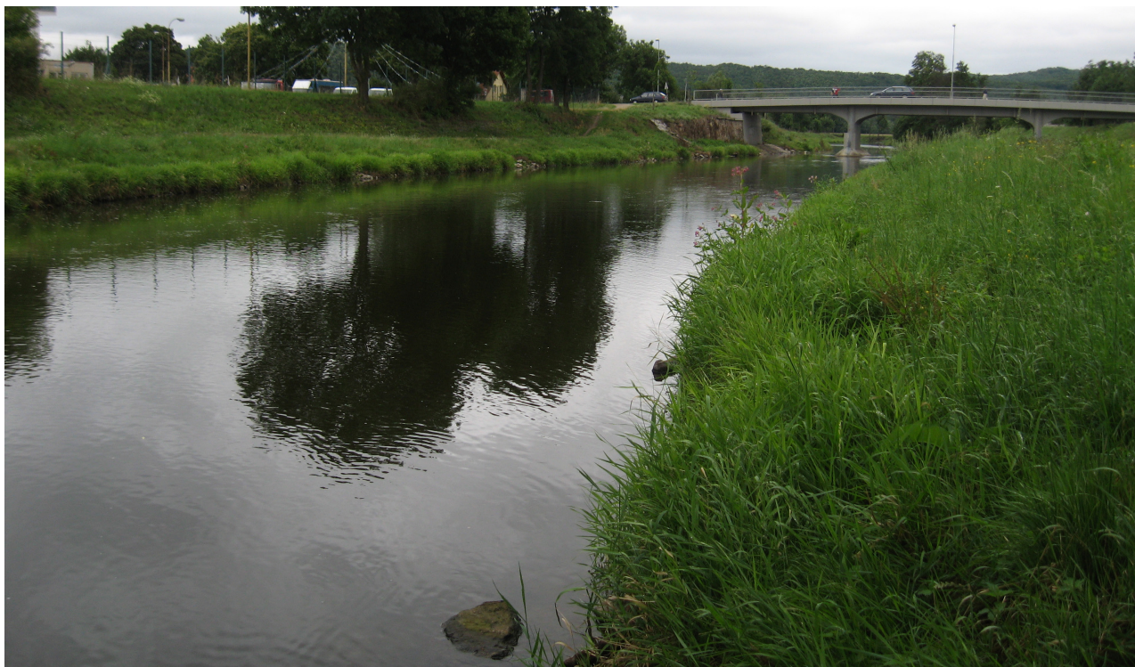
Obr. 2. Jihlava pod ústím Oslavy (lok. č. 1). Zde se vyskytuje početnější populace druhu Unio crassus . Fig. 2. The Jihlava River downstream of the inflow of the Oslava River (site 1). Numerous population of Unio crassus lives there.

HORSÁK M., ČEJKA T., JUŘIČKOVÁ L., BERAN L., HORÁČKOVÁ J., HLAVÁČ J. Č., DVOŘÁK L., HÁJEK O., DIVÍŠEK J., MAŇAS M. & LOŽEK V., 2021: Check-list and distribution maps of the molluscs of the Czech and Slovak Republics. – Online at http://mollusca.sav.sk/malacology/checklist.htm . Checklist updated at January 12, 2021, maps updated at January 24, 2021. https://doi.org/10.5281/zenodo.4459206